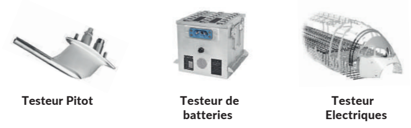
Testeur Pitot Testeur de batteries Testeur Electriques